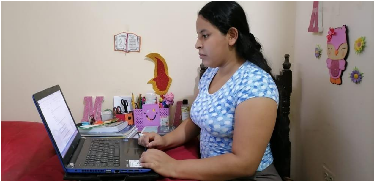
REALIZACIÓN DE ENTREVISTA A PERIODISTAS DE LA CIUDAD DE QUEVEDO