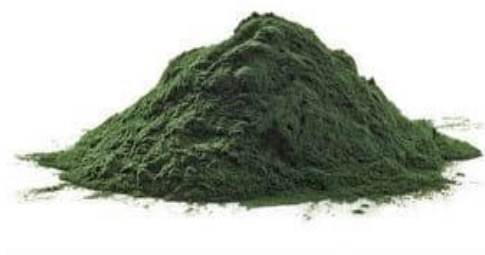
FIGURA 1. Harina de algas para la alimentación de animales de granja