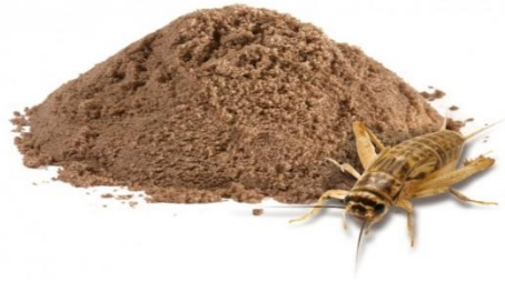
FIGURA 2 Harina de grillo para la alimentación de animales de granja.