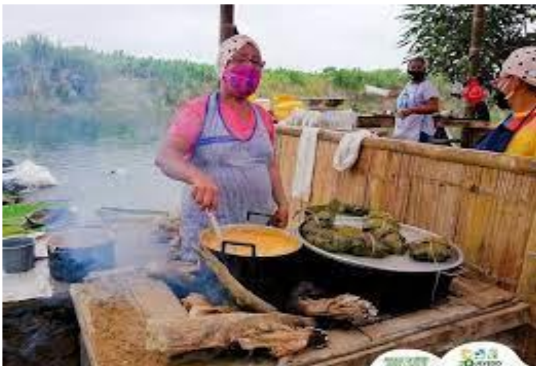
Foto 3. turismo cultural de Quevedo