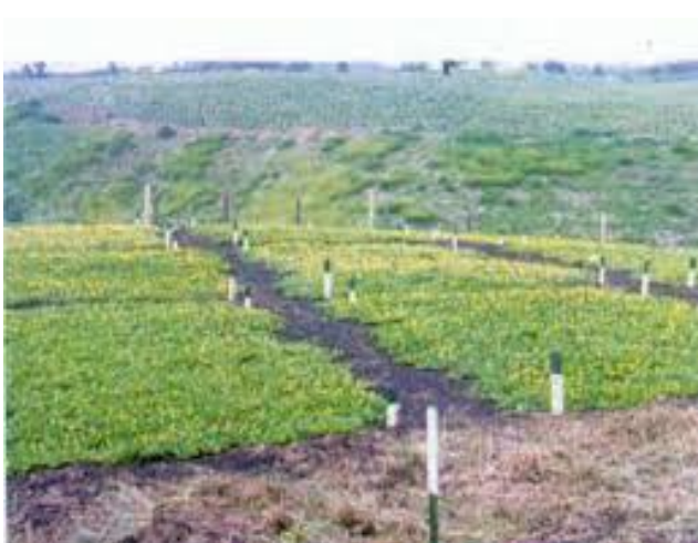
Ilustración 3. Siembra de Maní forrajero