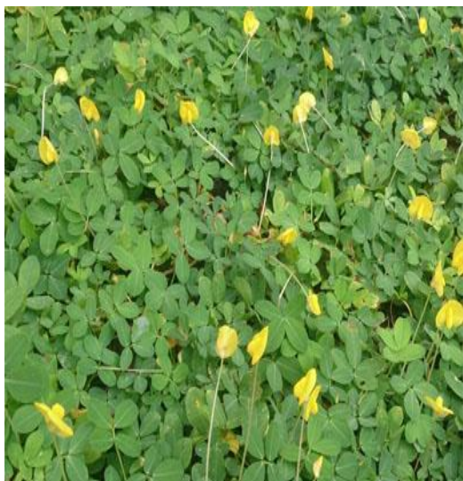
Ilustración 1. Maní forrajero ( A. pintoi )