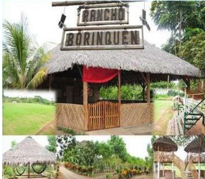
Ilustración 5 Rancho Borinquen

Rancho Borinquen: Es una cabaña con áreas verdes y cuenta con cabañas, áreas verdes y mucho espacio para realizar eventos como actos sociales, deportivos o culturales. (Sánchez García, 2019)