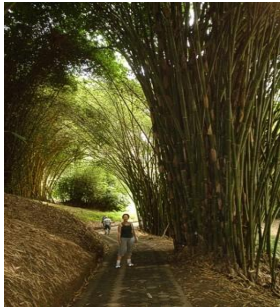
Ilustración 2 Bambusario

tienen su respectivo letrero con sus datos, en su mayoría de origen asiática. Con senderos marcados y un espacio de descanso en el centro del lugar. (Guerra Rizzo, 2021)