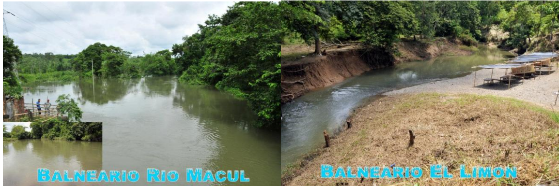
Ilustración 4 Balnearios de agua dulce (Limón, Macul, Guayas, Caraca, Congo)

Balnearios de agua dulce: Su geográfica y entorno permiten que el área posea varios puntos atractivos digno de visitar. Los balnearios de agua dulce son: Macul El Congo, el balneario natural de La Caraca, El Limón, ubicados en la cabecera cantonal. (Sánchez García, 2019)