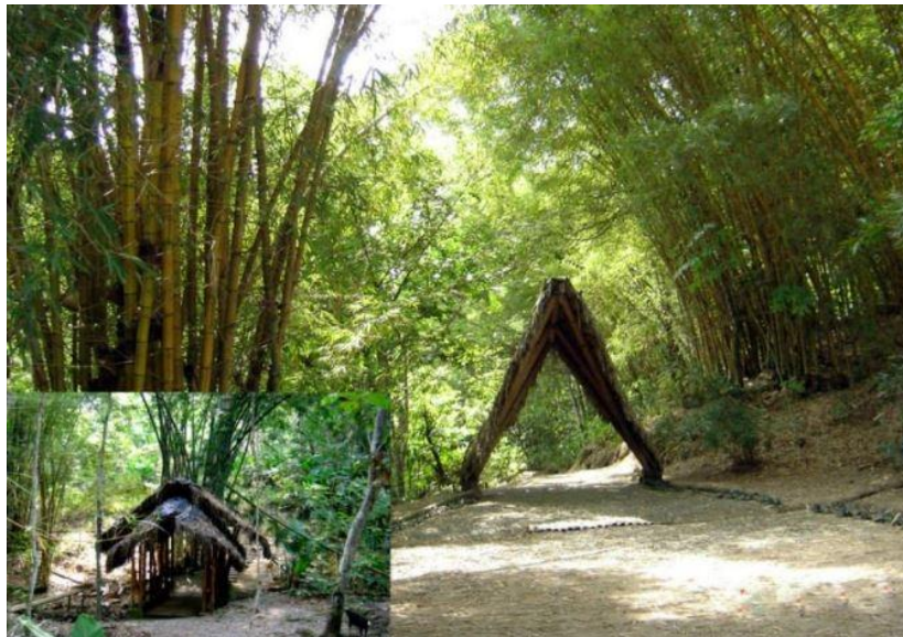
Ilustración 1 Reserva de los monos

Reserva de los Monos: El atractivo se encuentra ubicado a las afueras de la zona urbana del cantón El Empalme, la calle de acceso para llegar a las instalaciones del (Celec ep hidronación), quienes gestionan el ingreso de las personas a los lugares de interés turísticos. Además, para poder acceder a este sitio turístico se necesita la autorización del gerente de las instalaciones, en el atractivo se llevan a cabo actividades de fotografía, senderismo y observación de flora y fauna. (Guerra Rizzo, 2021)