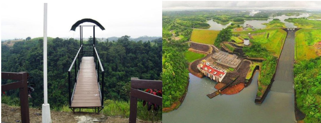
Ilustración 3 Mirador Represa Daule-Peripa

Mirador Represa Daule – Peripa: Es un área ubicada en una pequeña pendiente dentro de las instalaciones de (CELEC EP HIDRONACIÓN), en el lugar cuenta con una cabaña de descanso en donde se encuentran fotografías de las personas que alguna vez estuvieron realizando actividades de festejo, se puede observar desde ahí el área de la Represa y la maquinaria, en el lugar se puede únicamente hacer fotografía. (Guerra Rizzo, 2021)