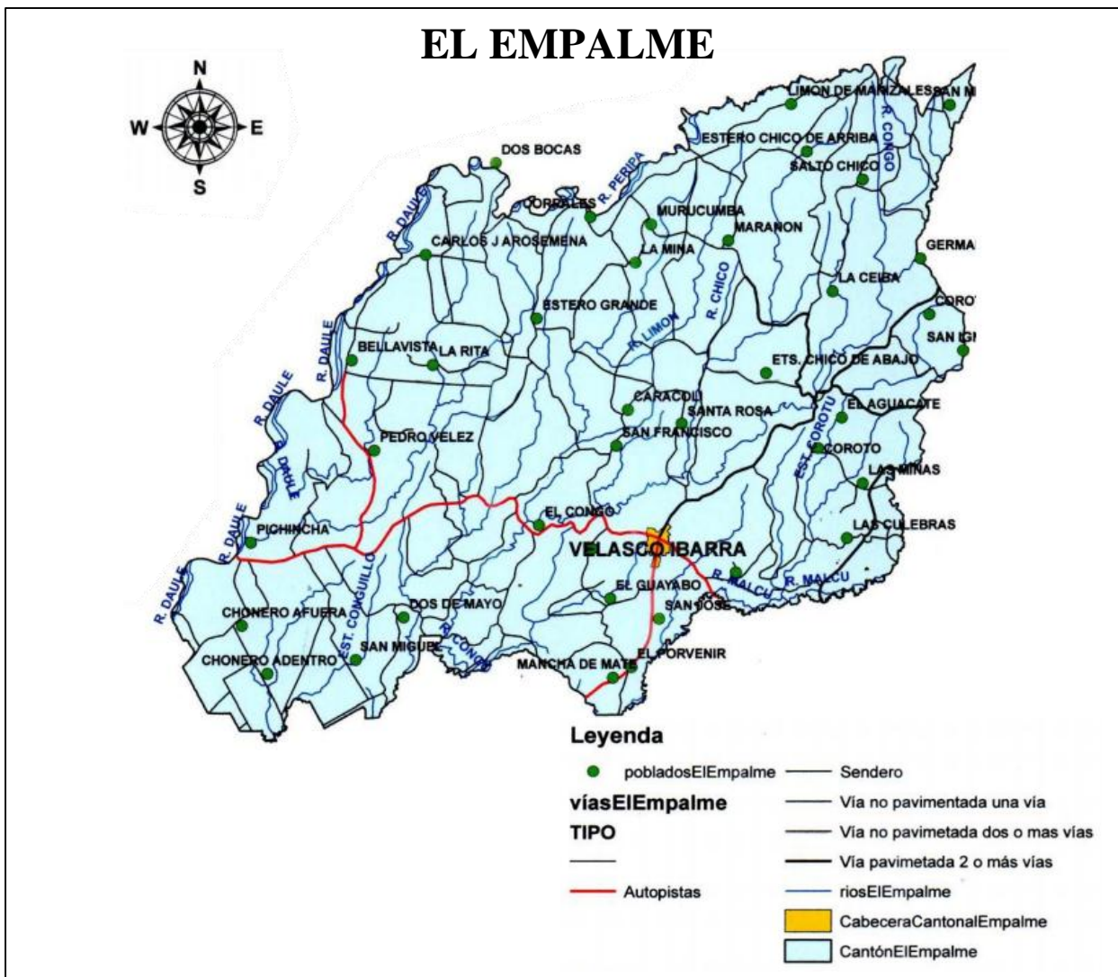
Gráfico 1 Mapa del cantón El Empalme

El cantón El Empalme está ubicado a 167 km de Guayaquil, cuenta con una temperatura mínima de 21°C y máxima de 26°C, siendo considerado de clima tropical con temperatura media, y su precipitación promedio anual es de 1600 - 3200 mm. En el territorio del cantón se levantan una serie de colinas y cerros de poca altura. Al oeste, está rodeado por el Río Daule. Sus afluentes principales son: Congo, Macul y Peripa (Sánchez García, 2019, págs. 20-21).