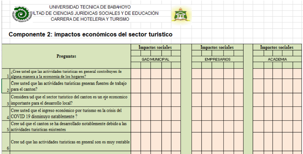
Ilustración 6 Matriz del cuestionario para la aplicación de la encuesta