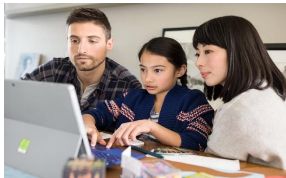
Ilustración 2. Aprendizaje desde casa.