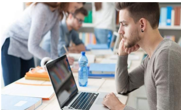
Ilustración 1. Medios digitales en la actualidad.