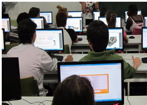
Ilustración 4. Facilidad de aprendizaje.