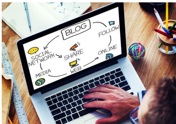
Ilustración 3. Tendencia tecnológica en la actualidad.