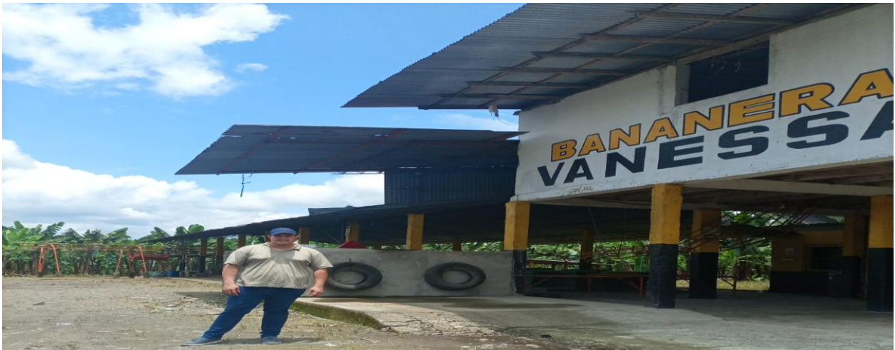
Figura 2 Dentro de la hacienda bananera para realizar las entrevistas

Realizando las entrevistas en las actividades agrícolas