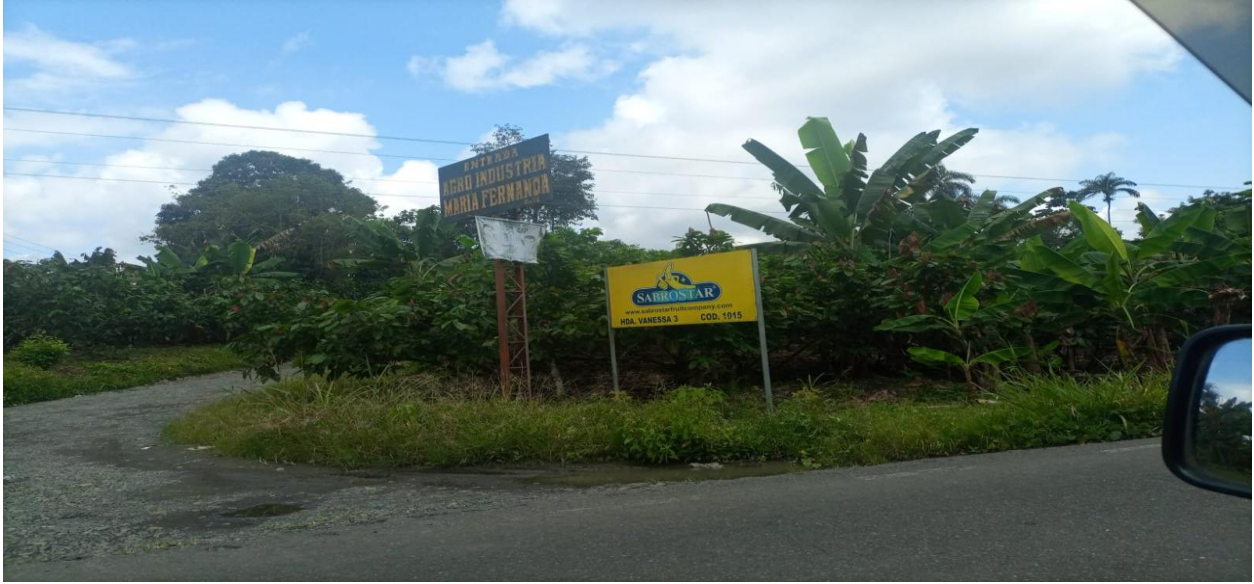
Figura 1 Hacienda bananera del recinto el Vergel

Nota: Ingresando al recinto El Vergel, para realizar las entrevistas en el área agrícola. Elaborado por autor.