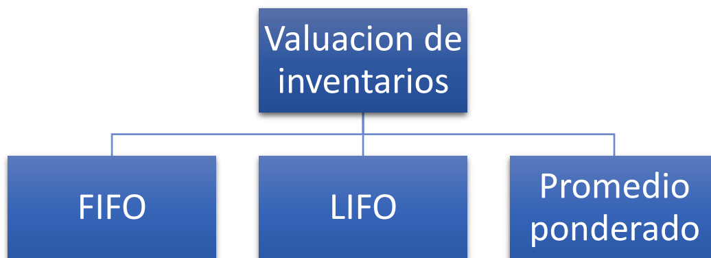
Figura 1. Métodos de valuación de inventarios

Existen diferentes métodos de valuación de inventarios, cada uno con sus propias ventajas y desventajas. A continuación, se describen algunos de los métodos más utilizados: