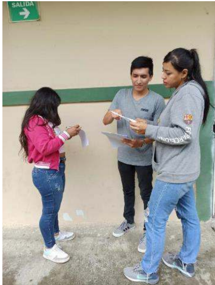
Encuesta realizada a estudiantes de comunicación social

Fotos tomadas como evidencia sobre la encuesta realizada a los estudiantes de comunicación social de la UTB Extensión Quevedo