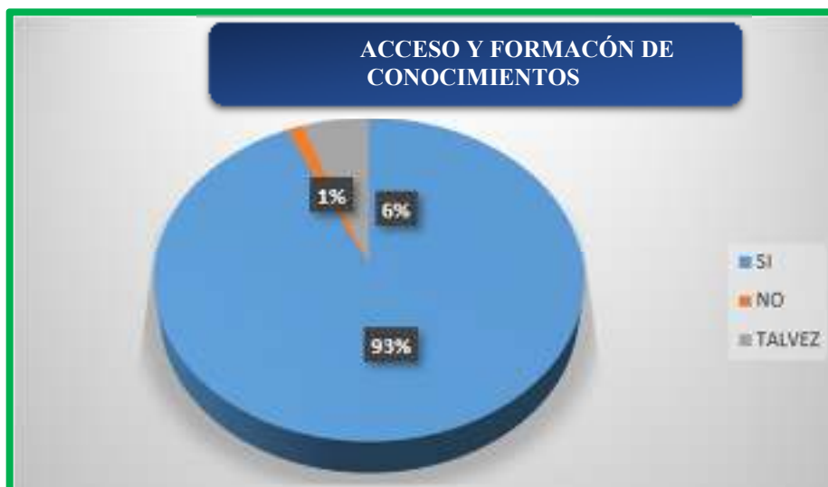
Figura 5. ¿Cree usted que el periodismo de investigación ayuda al acceso y formación de conocimientos?

Según se observa en la figura 5, el 93% de las personas encuestadas dicen que, si consideran que el periodismo de investigación ayuda al acceso y formación de conocimientos, mientras que el 6% dice que tal vez, y el 1% dijo que no.