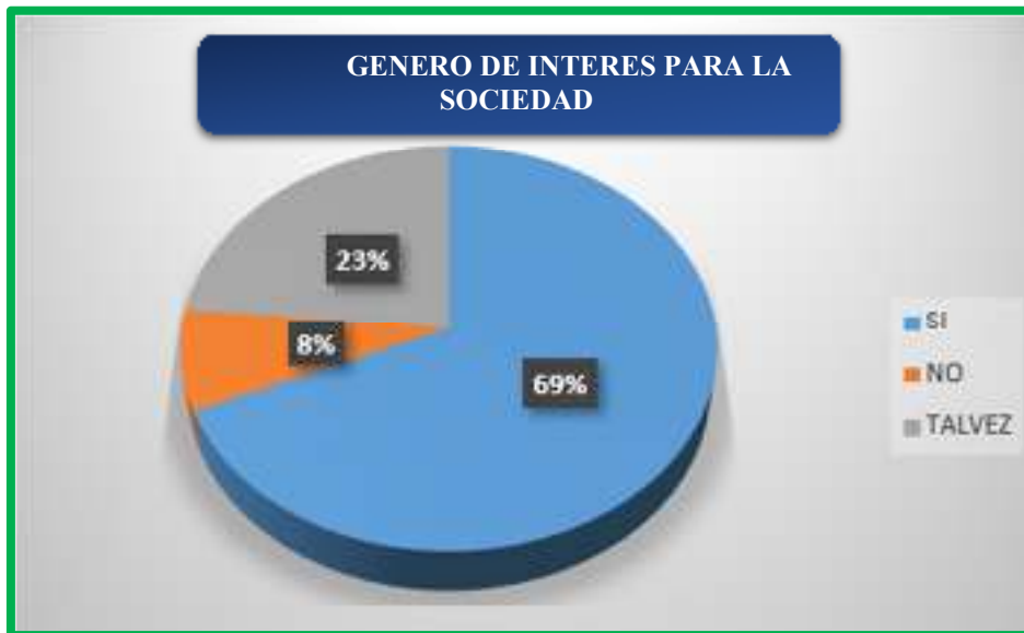
Figura 4. ¿Cree usted que el periodismo de investigación en la ciudad de Quevedo es un género de interés para la sociedad?

Según se observa en la figura 4, el 69% de las personas encuestadas dicen que, si consideran que el periodismo de investigación en la ciudad de Quevedo es un género de interés para la sociedad, mientras que el 23% dice que tal vez, y el 8% dijo que no.