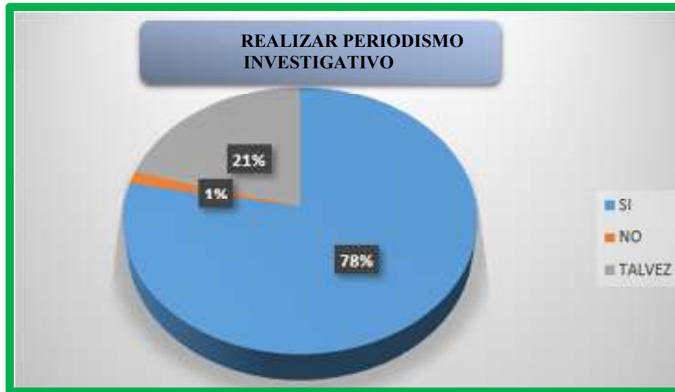
Figura 2 ¿Piensa usted que los estudiantes estarían interesados en realizar periodismo investigativo como futuros comunicadores?

Según se observa en la figura 2, el 78% de las personas encuestadas dicen que, si creen que los estudiantes estarían interesados en realizar periodismo investigativo como futuros comunicadores, mientras el 1% dice que no, y el 21% dijo que tal vez.