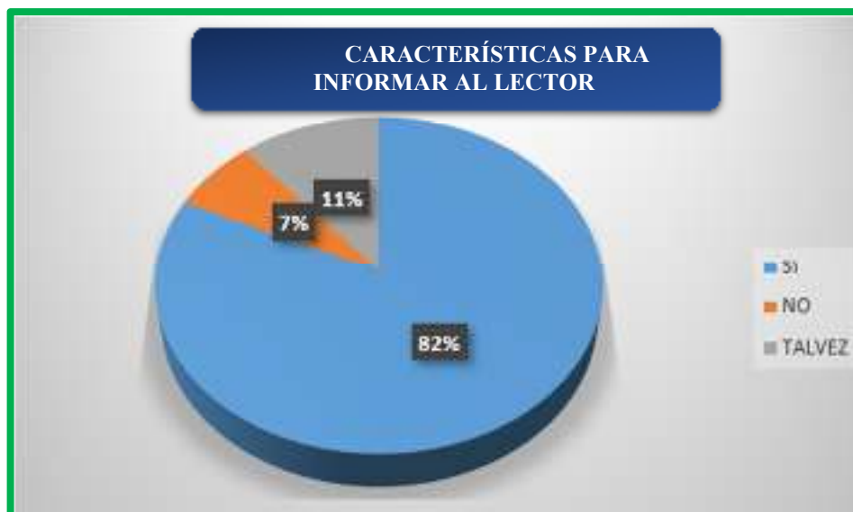
Figura 6. ¿Considera usted que el periodismo investigativo tiene las características necesarias para informar de manera oportuna al lector?

Según se observa en la figura 6, el 82% de las personas encuestadas dicen que, si consideran que el periodismo investigativo tiene las características necesarias para informar de manera oportuna al lector, mientras que el 7% dice que no, y el 11% dijo que tal vez.