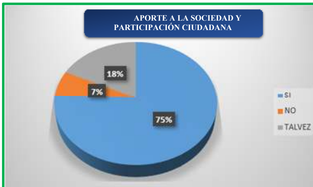
Figura 7. ¿Considera usted que el periodismo investigativo es un aporte a la sociedad y ayuda a la participación ciudadana?

Según se observa en la figura 7, el 75 % de las personas encuestadas dicen que, si consideran que el periodismo investigativo es un aporte a la sociedad y ayuda a la participación ciudadana, mientras que el 7% dice que no, y el 18% dijo que tal vez.