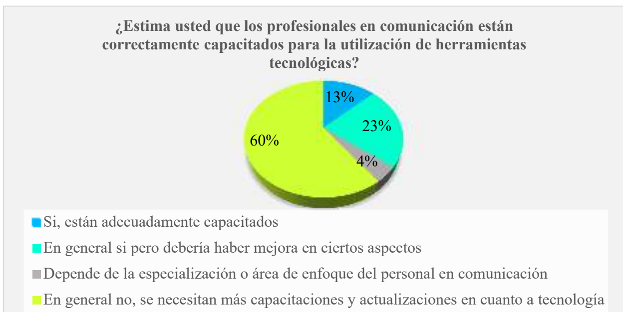
Gráfico 4. Periodistas y capacitación en la utilización de recursos tecnológicos

Análisis: los ciudadanos encuestados inciden en un 60% que los comunicadores en general no están capacitados, que necesitan más capacitaciones y actualizaciones en cuanto a tecnología, mientras que un 23% manifestaron que en general si pero debería mejorar en ciertos aspectos, por otra parte con un 13% estiman que si estas adecuadamente capacitados, mientras que el 4% de la población indica que depende de la especialización o área de enfoque del personal en comunicación.