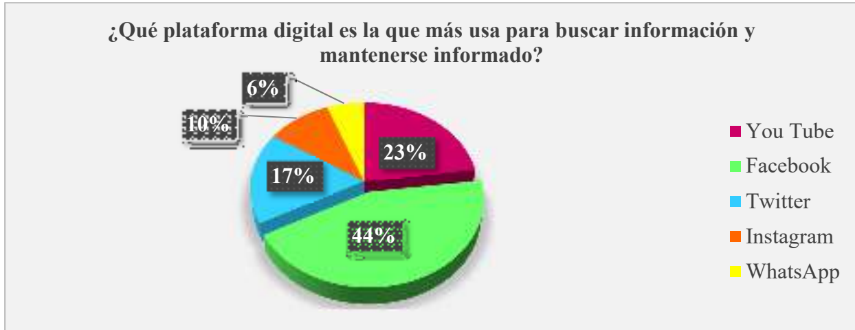
Gráfico 2. Plataforma digital más usada para mantenerse informados

Análisis: Entre las plataformas digitales más usadas por los ciudadanos del barrio San Vicente del cantón Urdaneta para buscar información y mantenerse informados está en primer lugar la plataforma de Facebook con un 44%, seguida de You Tube con un 23%, Twitter con un 17%, Instagram con un 10% de la población encuestada mientras que con un 6% WhatsApp, dando como resultado preciso que los ciudadanos del barrio la plataforma que más usan es Facebook seguida de You Tube.