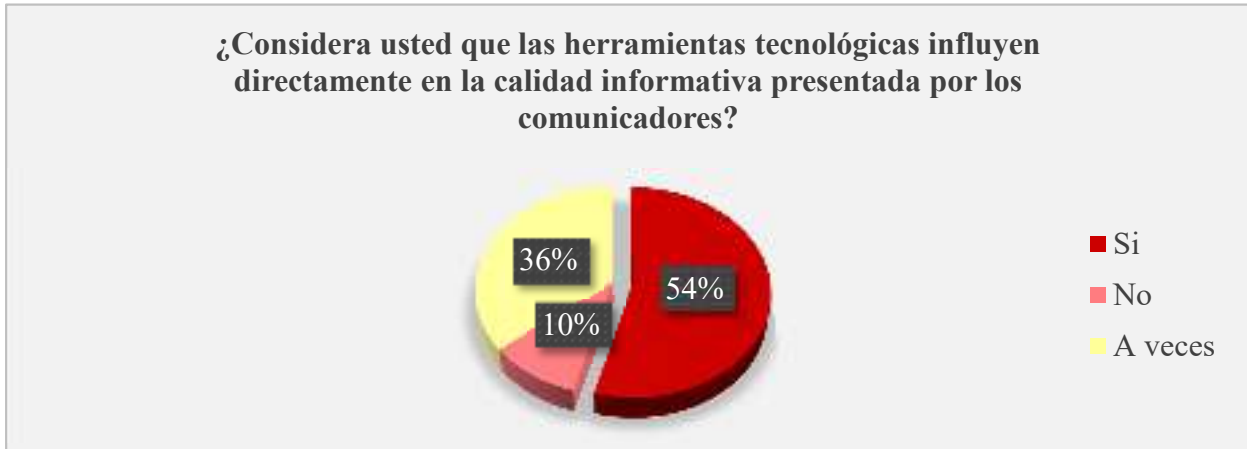
Gráfico 5. Influencia de las herramientas tecnológicas en la calidad informativa

Análisis: frente a esta interrogante los ciudadanos encuestados indicaron con un 54% que si consideran influyentes a las herramientas tecnológicas en la calidad informativa difundida por los comunicadores, de igual manera un 36% de la misma población indico que a veces estas influyen, mientras que un 10% de ellos coinciden en que no influyen en la calidad informativa presentada por estos profesionales.