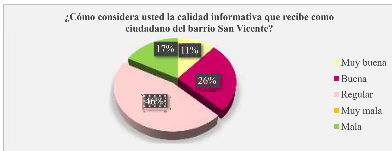
Gráfico 7. Grado de calidad informativa recibida en el barrio San Vicente

Análisis: según los datos obtenidos mediante la aplicación de la encuesta se obtuvo que un 46% de la población inciden en que la calidad informativa que ellos reciben es regular, mientras que un 26% manifestaron que es buena, seguida de un 17 % de ellos que la categorizan como mala, así mismo un 11% indicaron que la calidad de la información recibida en el barrio san Vicente es muy mala.