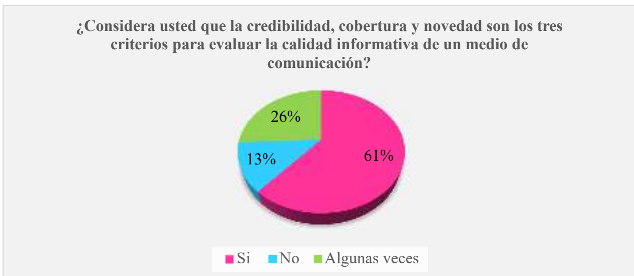
Gráfico 6. Criterios para evaluar la calidad informativa de un medio de comunicación

Análisis: frente a esta interrogante los ciudadanos encuestados indicaron con un 54% que si consideran influyentes a las herramientas tecnológicas en la calidad informativa difundida por los comunicadores, de igual manera un 36% de la misma población indico que a veces estas influyen, mientras que un 10% de ellos coinciden en que no influyen en la calidad informativa presentada por estos profesionales.