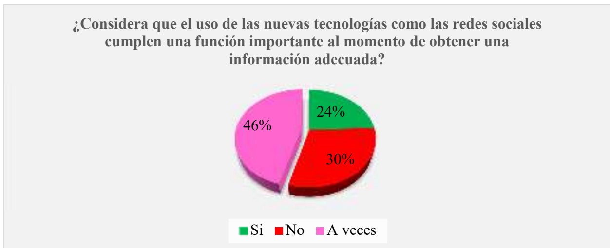
Gráfico 1. Función de las nuevas tecnologías para obtener información

Análisis: mediante esta pregunta podemos constatar que en un 46% del total de la población encuestada considera que a veces las nuevas tecnologías como las redes sociales cumplen una función importante al momento de obtener una información adecuada, mientras que un 24% considera que si y un 30% que no, quedando claro entonces que gran parte de la población consideran que no cumplen una función adecuada.