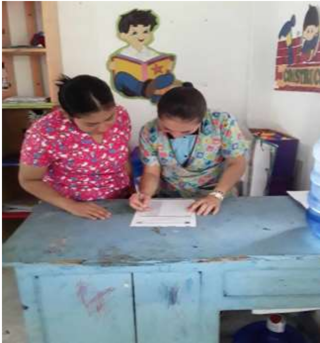
Elaborador por: Estefanía Calle