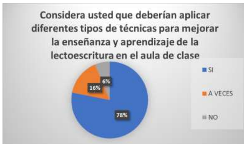
GRÁFICO 4. Técnicas del aprendizaje,

Fuente: Docente y padres de familia de U.E. Francisco Huerta Rendón Elaborador por: Estefanía Calle