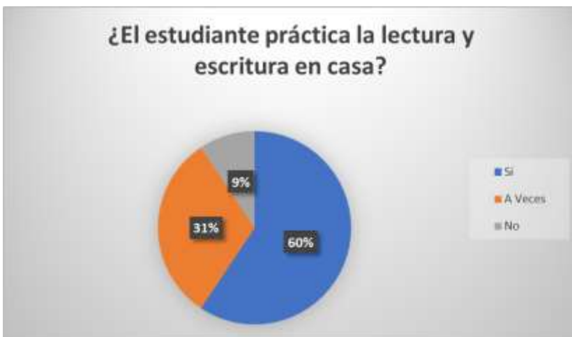
GRÁFICO 2. Práctica de la Lectoescritura en casa.

Fuente: Docente y padres de familia de U.E. Francisco Huerta Rendón Elaborador por: Estefanía Calle