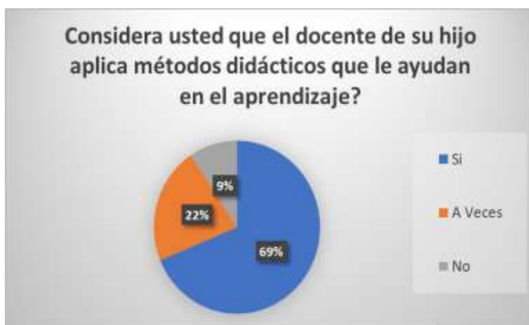
GRÁFICO 3. Métodos didácticos.

Fuente: Docente y padres de familia de U.E. Francisco Huerta Rendón Elaborador por: Estefanía Calle