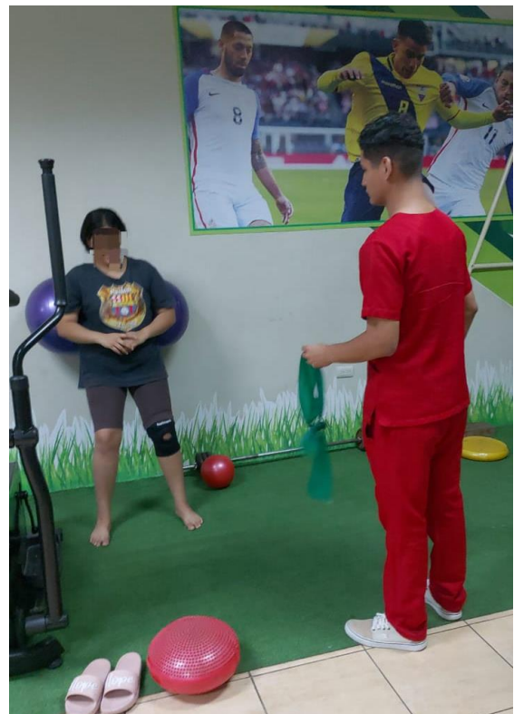
Ilustración 2 Ejercicios de estabilidad