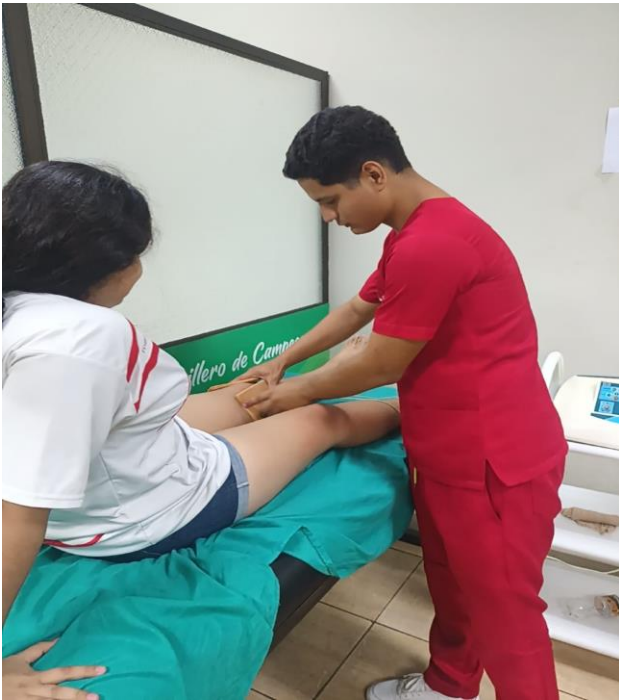
Ilustración 3 Aplicación de corriente