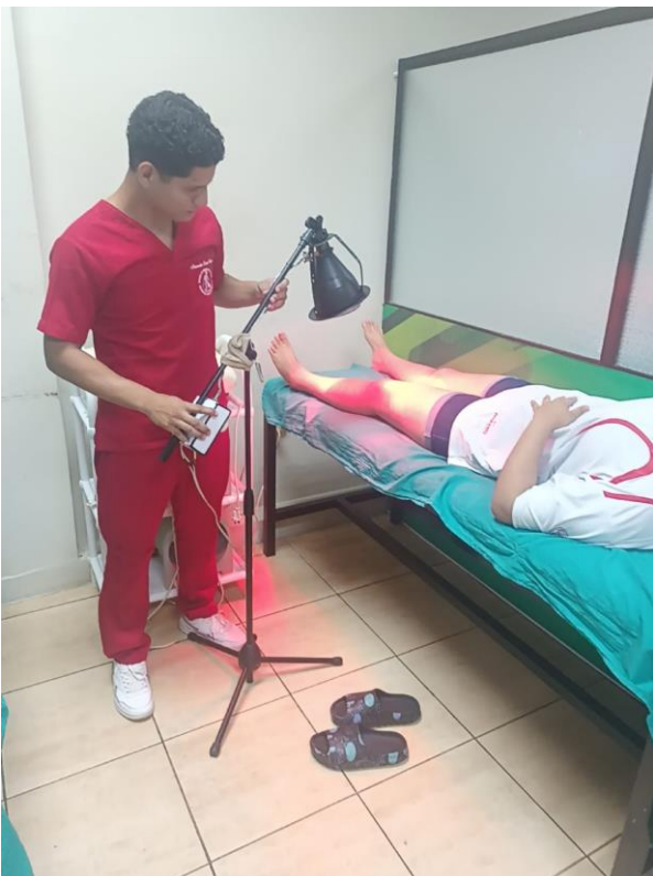
Ilustración 3 Aplicación de Infrarrojo