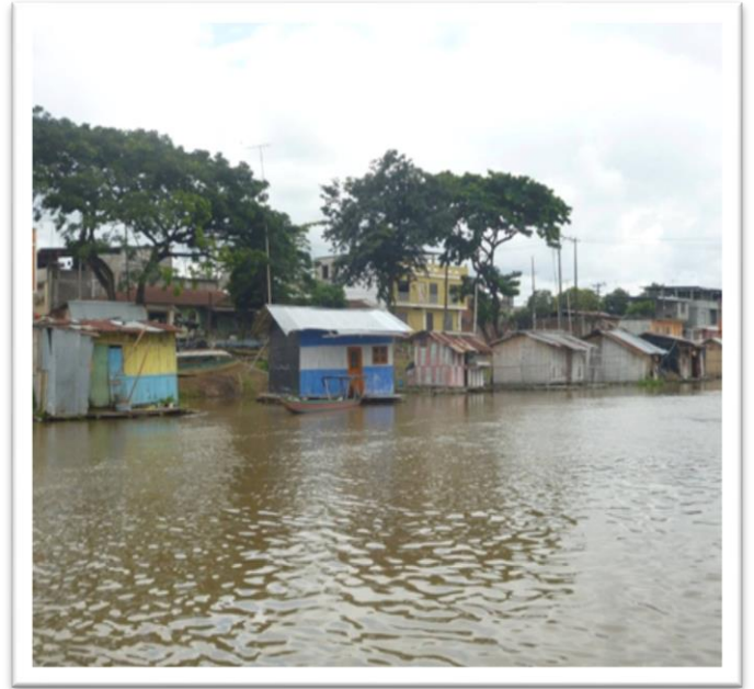
Vista panorámica de las Casas Flotantes