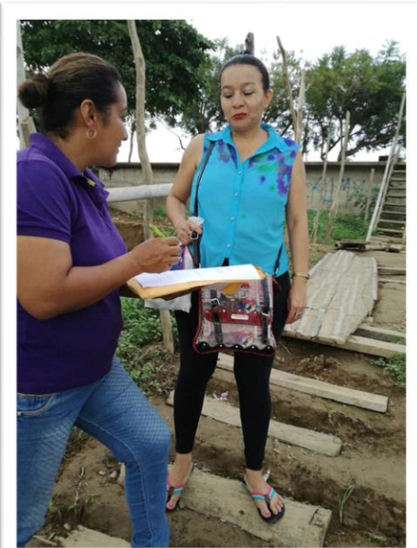
Encuestando a los residentes de Casas flotantes