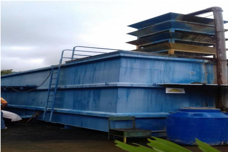
3 Sistema de Agua Potable en Mocache