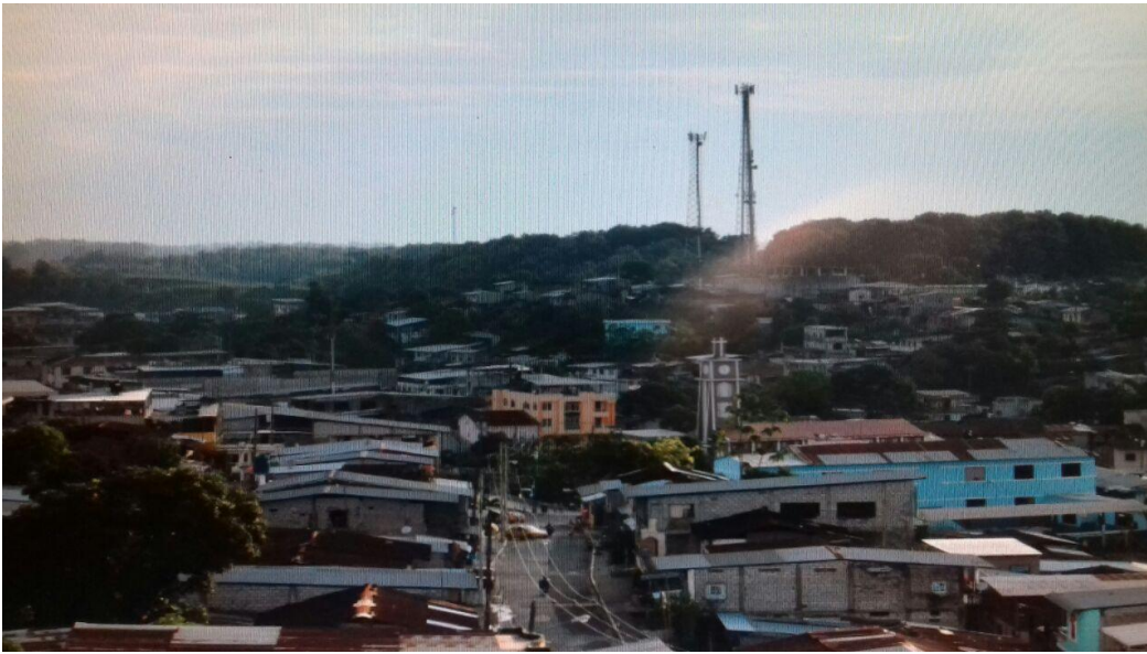
1 Cantón Mocache - Proyecto Integral de Agua Potable