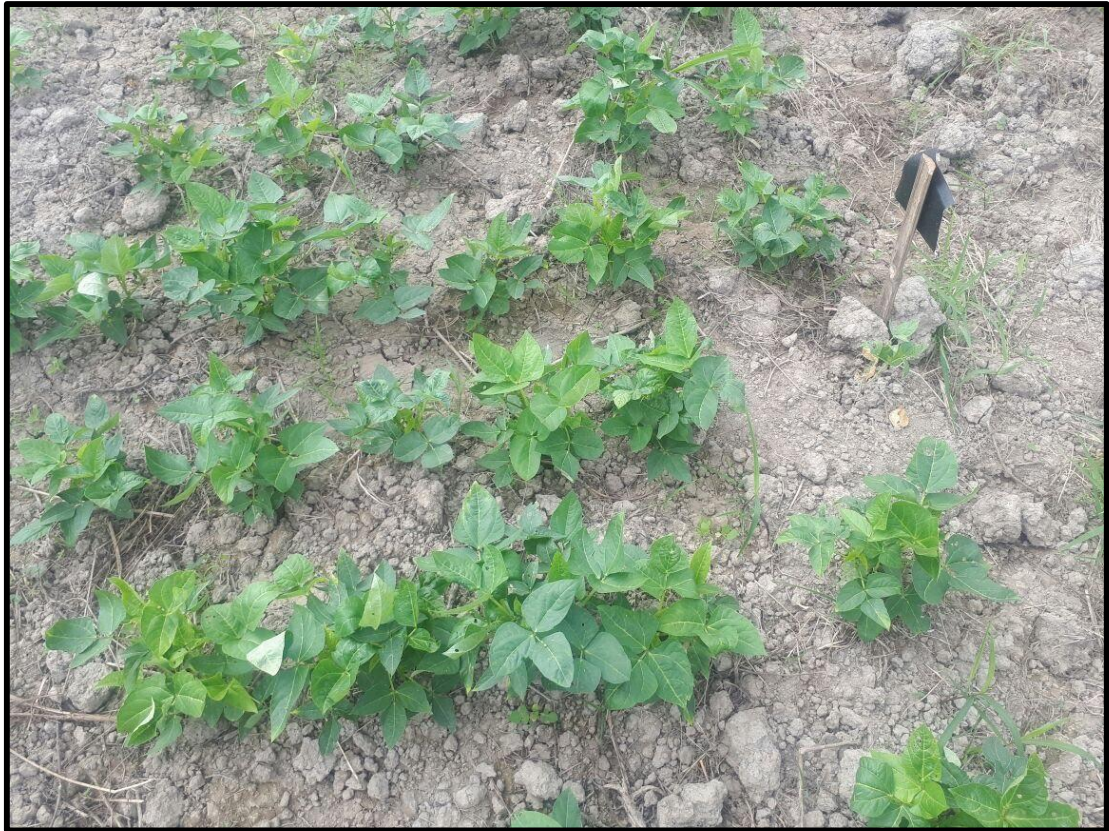
Fig. 5. Cultivo después de realizar la labor cultural de fertilización.