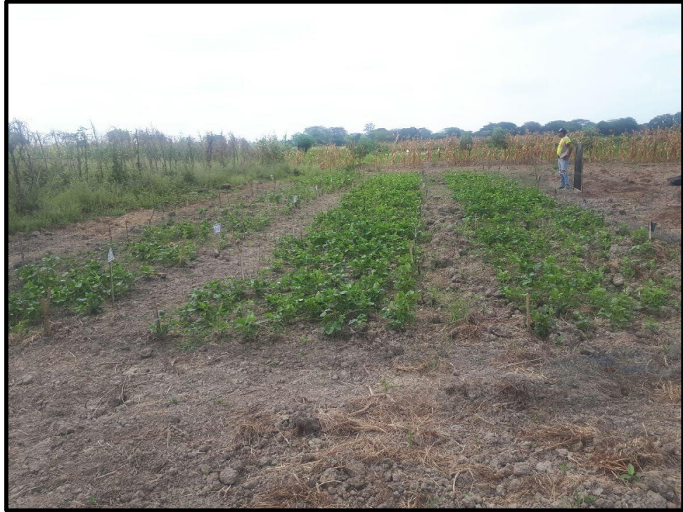
Fig. 3. Desarrollo del cultivo.