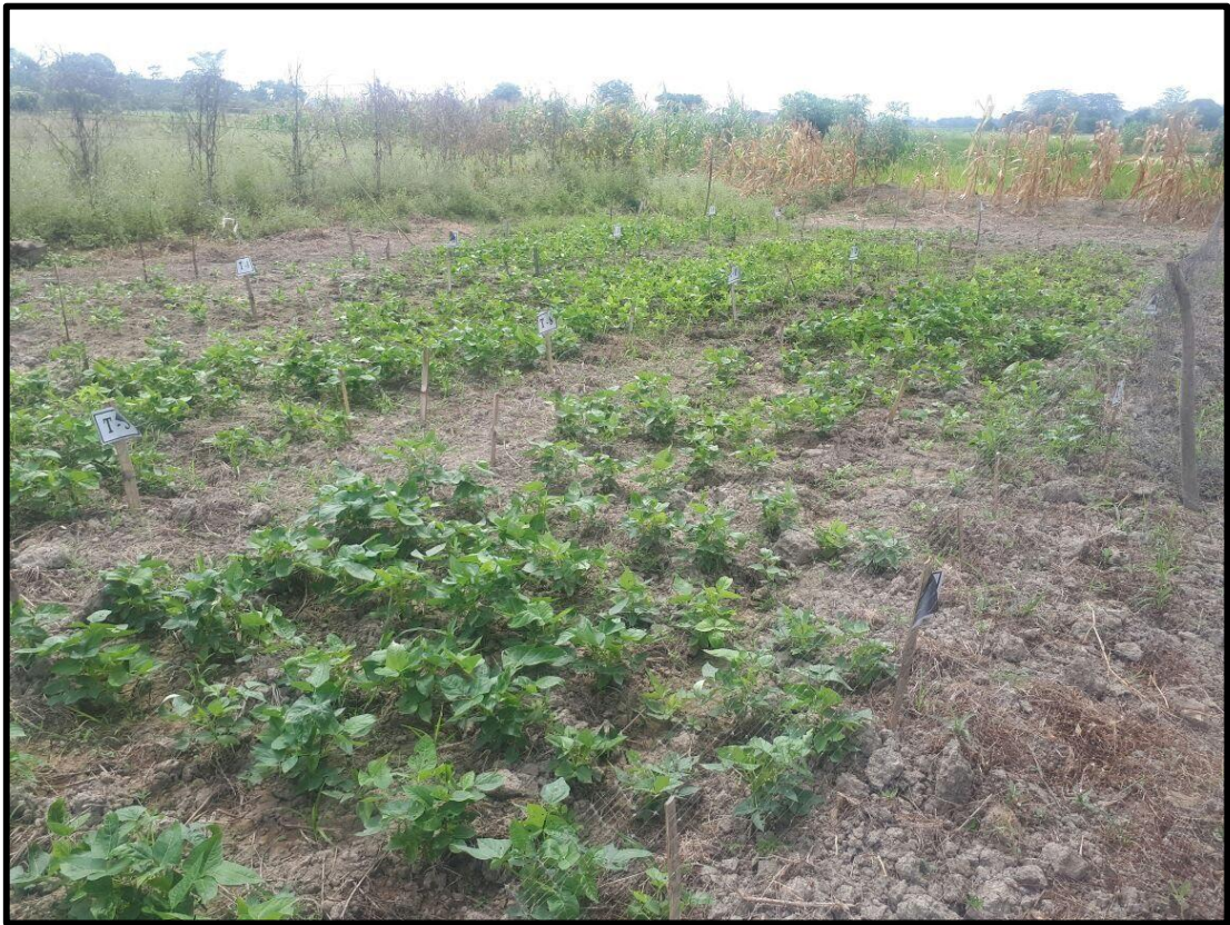
Fig. 7. Cultivo en desarrollo con el respectivo etiquetado.