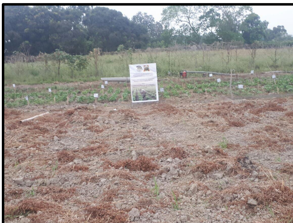
Fig. 2. Cultivo listo para ser cosechado y evaluar los datos de rendimiento.