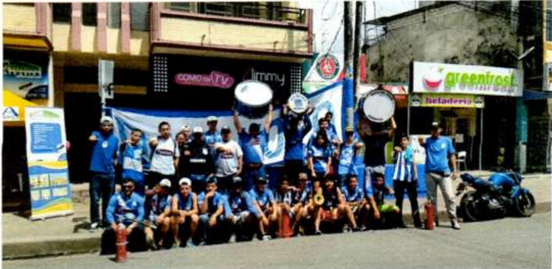
Barra de Emelec