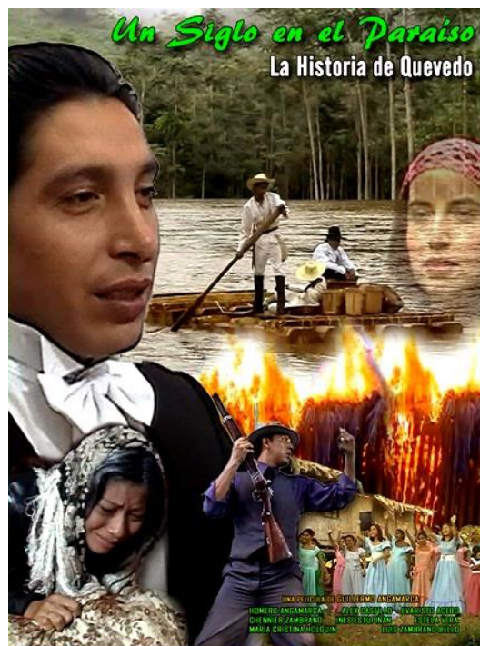
Ilustración 3. Portada del largometraje “Un siglo en el paraíso”