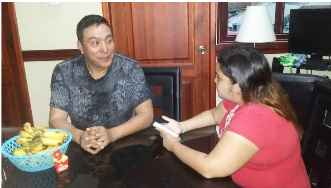
Ilustración 1. Realización de entrevista al productor de largometrajes