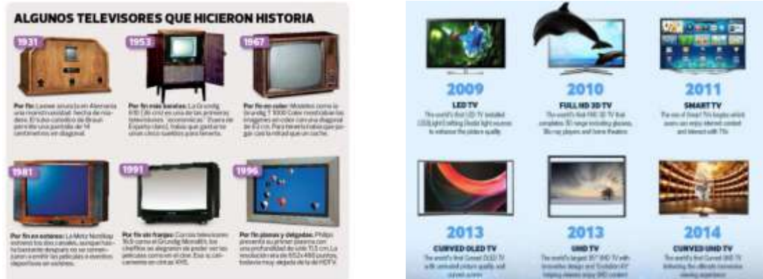
Figura # 1: Televisores de la historia