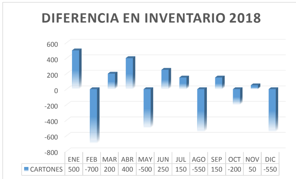
Grafico 3: Grafico de diferencias detectadas

determinada cantidad, mientras que en la constatación física muestra faltantes como se presenta a continuación.