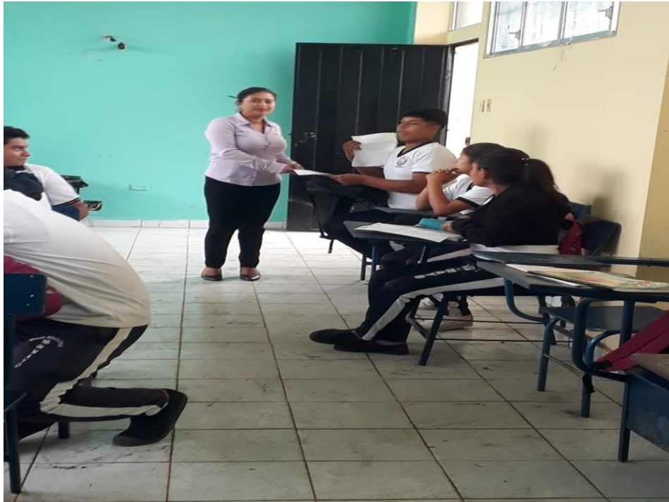
Figura N°5.- Encuesta a los estudiantes del primer año de bachillerato paralelo “B” de la Unidad Educativa “16 de mayo”