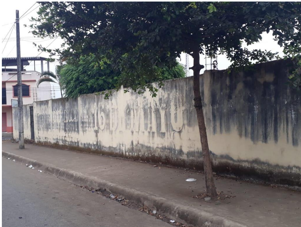
Figura N°6.- Réplica de la Unidad Educativa “16 de mayo”