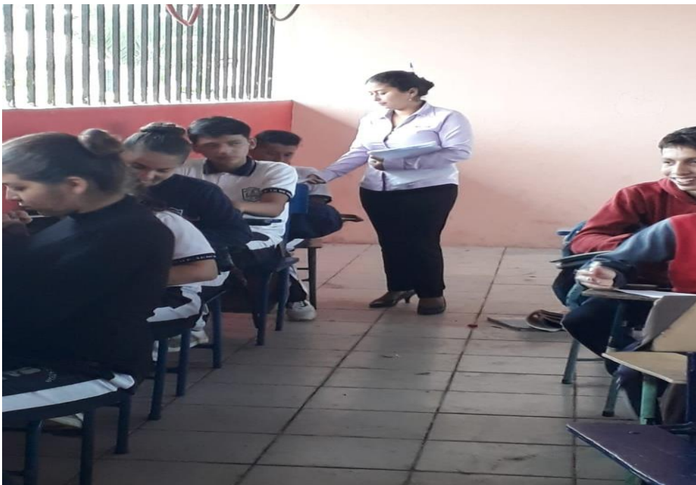
Figura N°4.- Encuesta a los estudiantes del primer año de bachillerato paralelo “A” de la Unidad Educativa “16 de mayo”