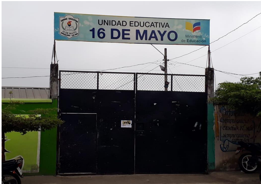
Figura N°1.- Unidad de análisis: Unidad Educativa "16 de mayo"