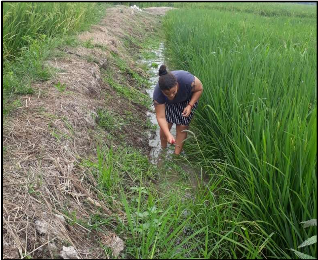
Fig. 8. Control de maleza manual en el perímetro del ensayo.