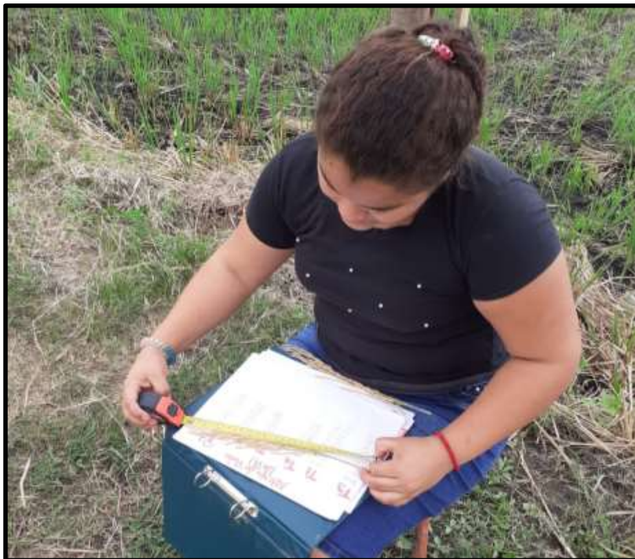
Fig. 10. Evaluación de datos (Longitud de Panícula)