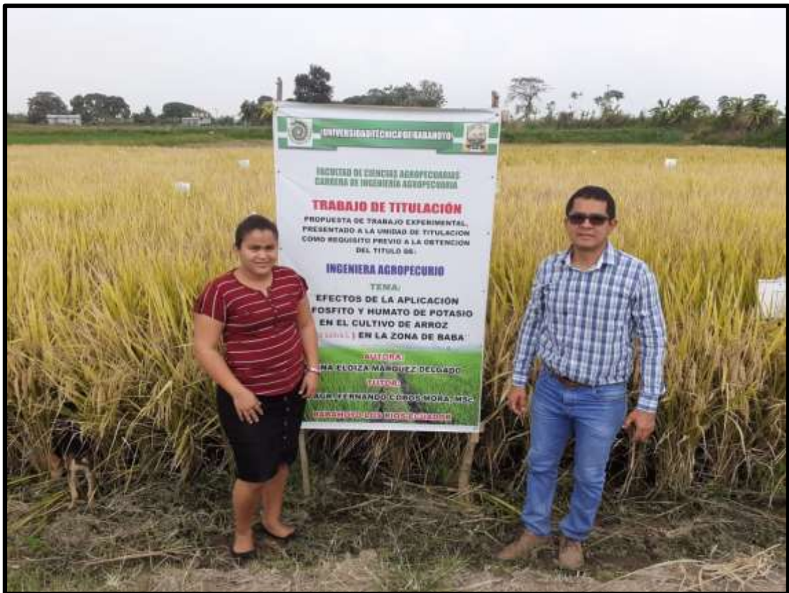
Fig. 12. Visita del Coordinador de Titulación.