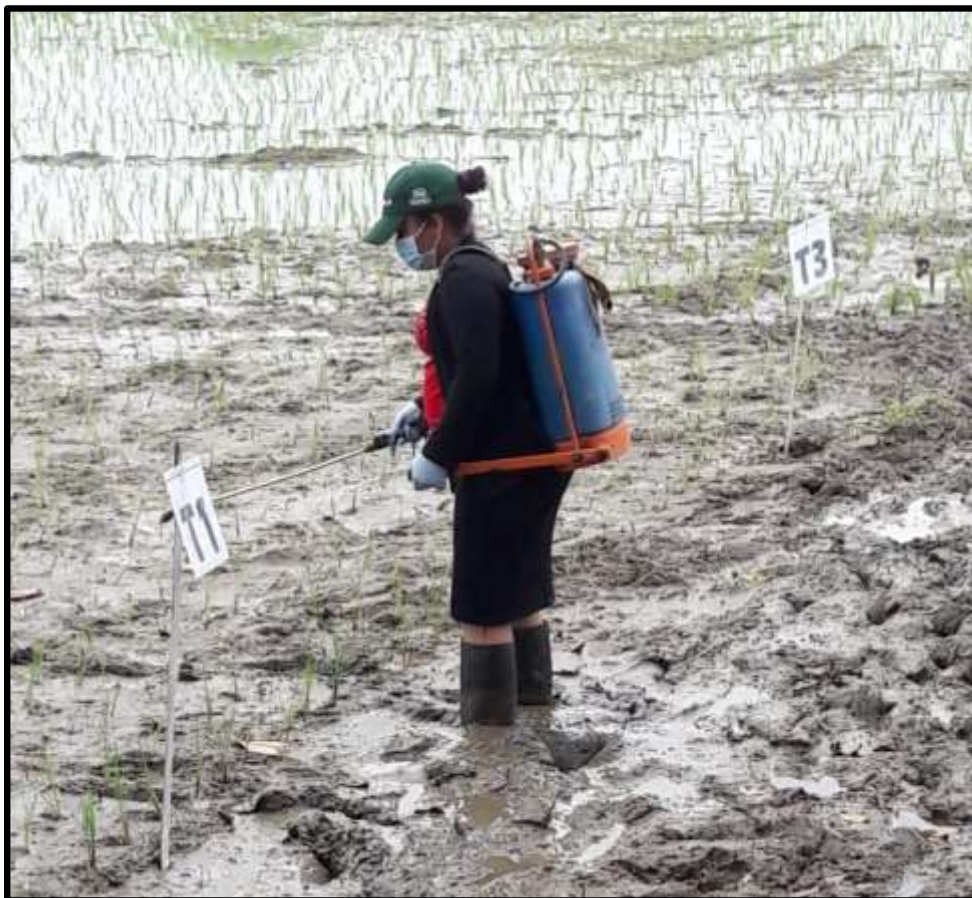
Fig. 6. Aplicación de productos