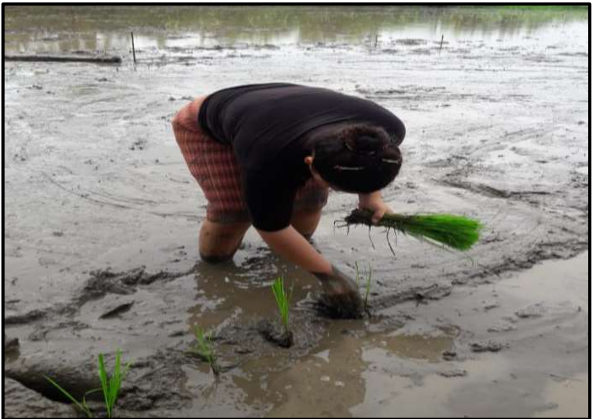
Fig. 4. Trasplante de arroz.