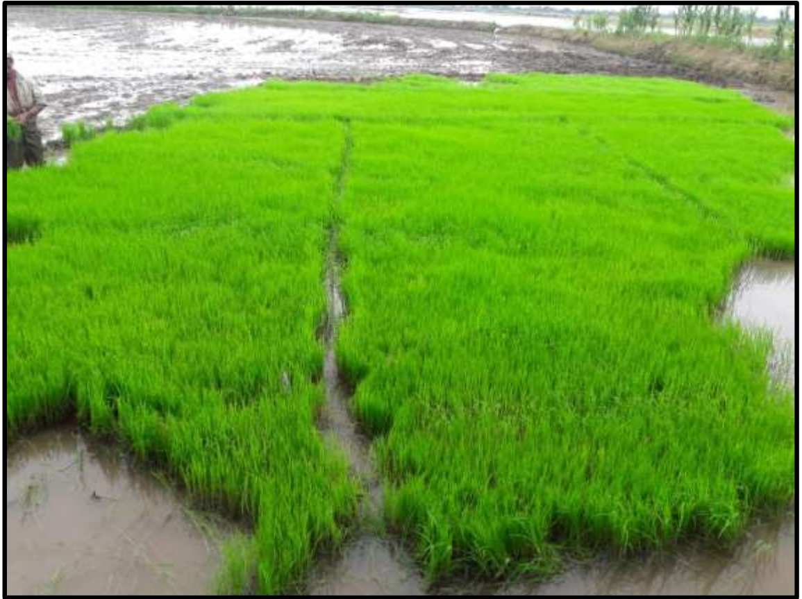
Fig. 3. Lechuguin listo para su trasplante.