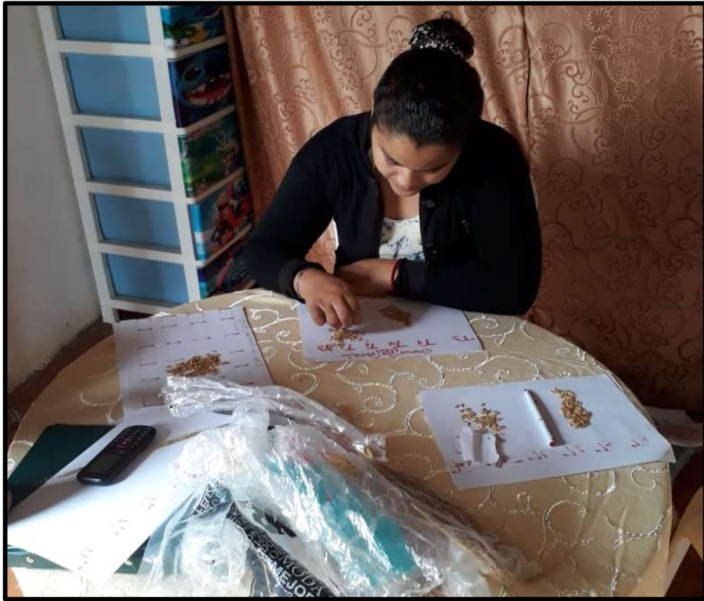
Fig. 11. Evaluación de datos (Conteo de granos por espigas)