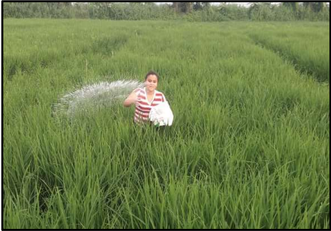
Fig. 7. Fertilización Nitrogenada (Urea)