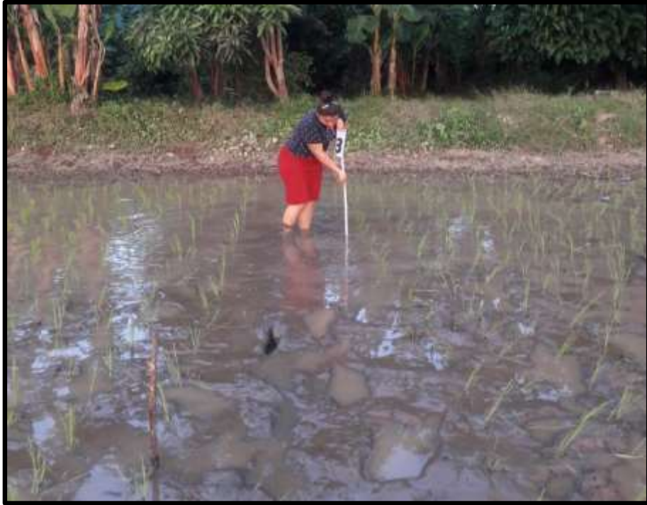
Fig. 5. Establecimiento e identificación de tratamientos.