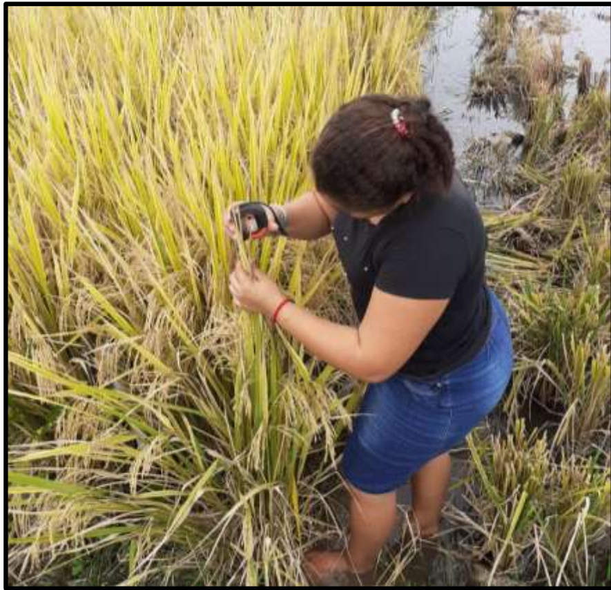
Fig. 9. Evaluación de dato (Altura de Planta)