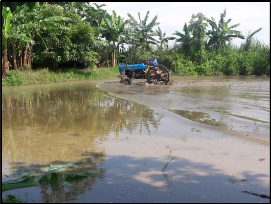
Fig. 1. Preparación del terreno (Fanguero) para la siembra de arroz.