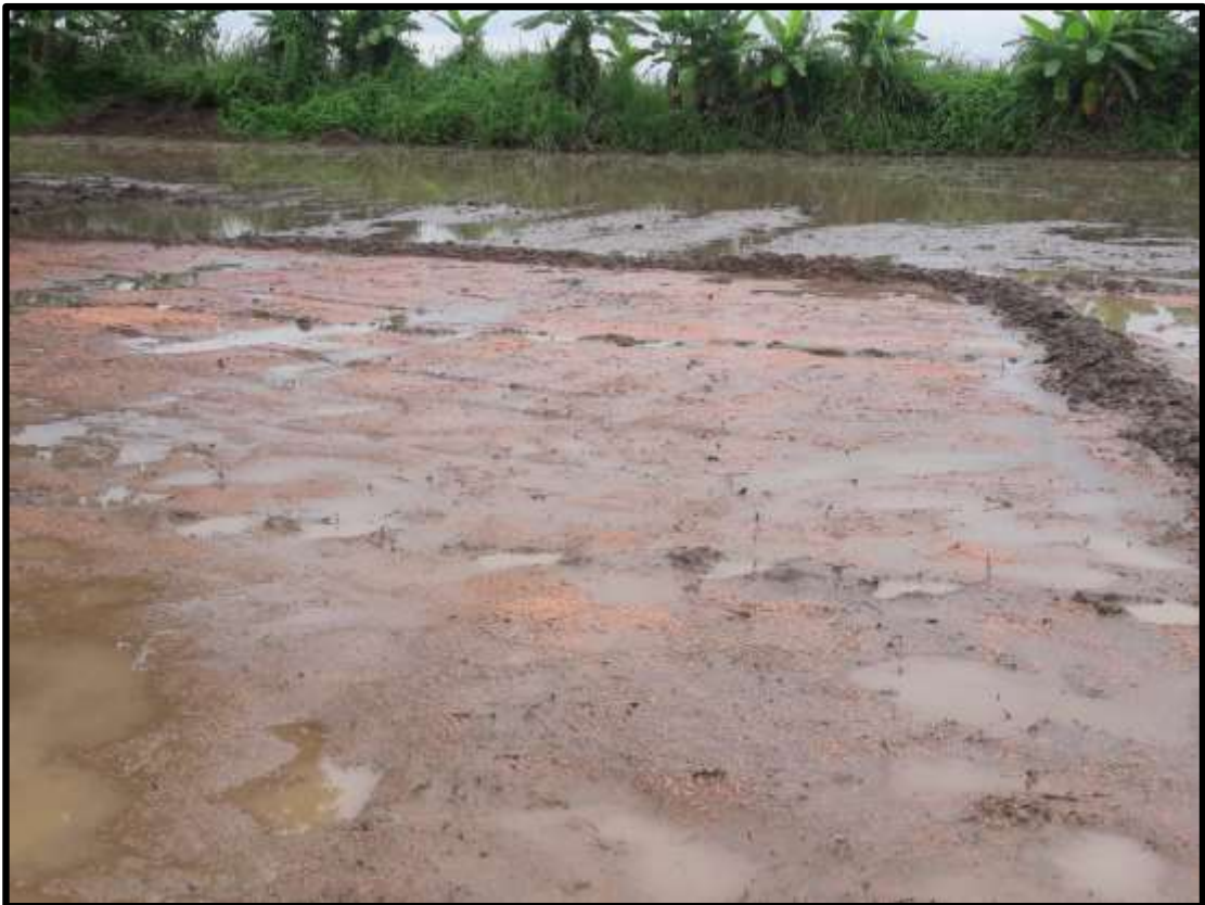
Fig. 2. Semillas de arroz para obtener plántulas (Lechuguin)