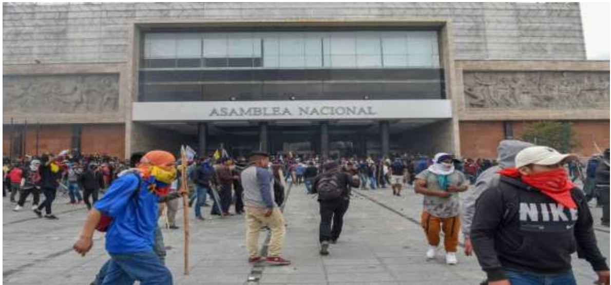
Gráfico 2. Manifestantes a las afueras de la Asamblea Nacional