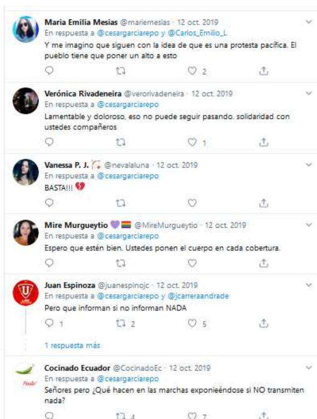
Gráfico 7. Comentarios de los ciudadanos sobre el Paro octubre 2019 a través de Twitter.