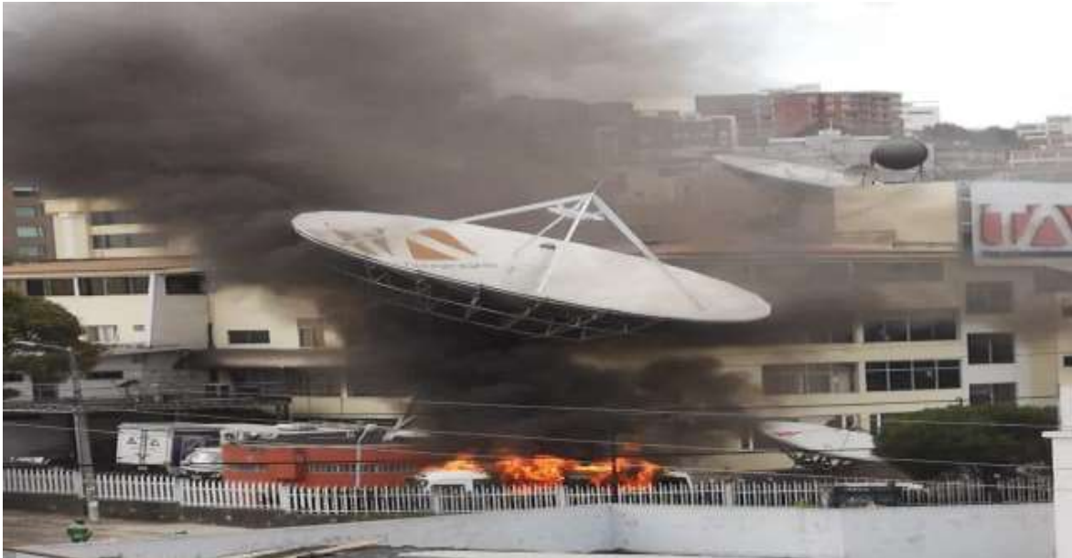
Gráfico 3. Ataque a las instalaciones del canal Teleamazonas, norte de Quito