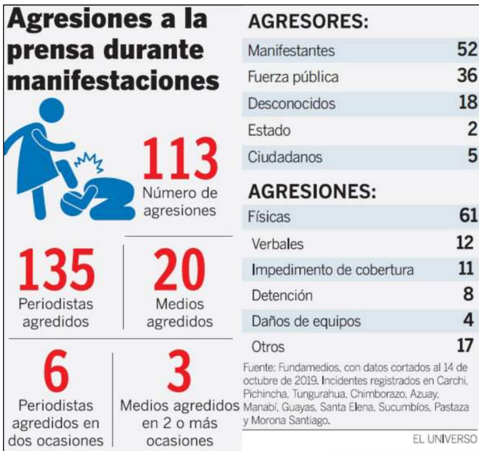
Gráfico 5. Incidentes registrados a periodistas