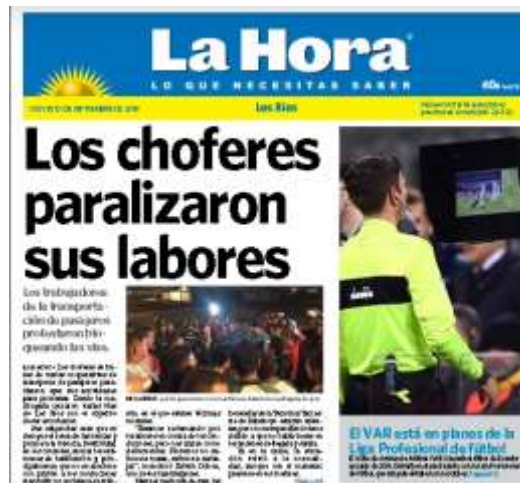
Gráfico 6 Choferes paralizan labores 13 de septiembre del 2018

el afectado, pero debido al escaso tiempo que este dispone no se logró obtener ningún comentario acerca de lo sucedido.