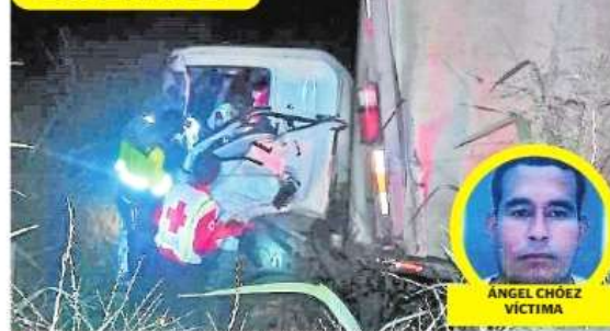
Uno de los camiones involucrados fue a parar a la cuneta.