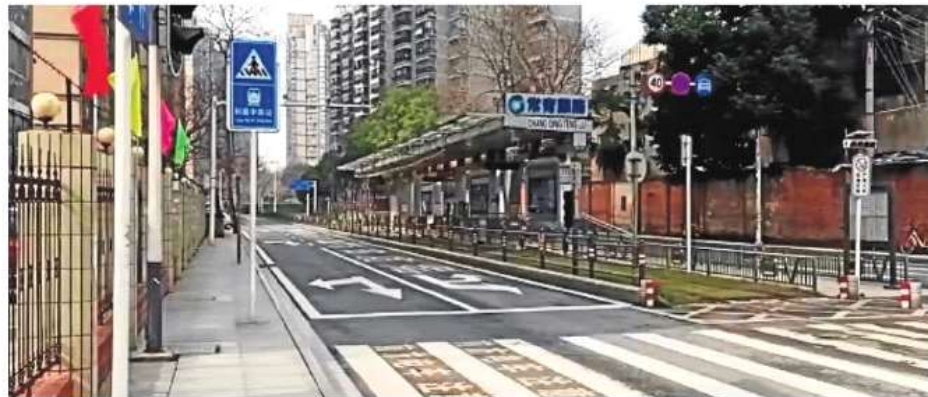
Imagen de las calles principales de Wuhan, vacías.