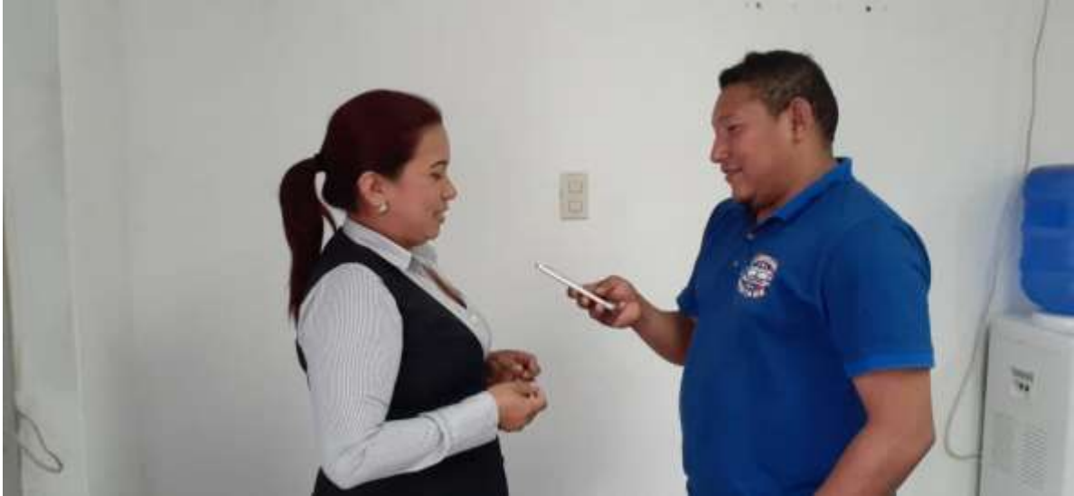
Encuestando a la ciudadanía