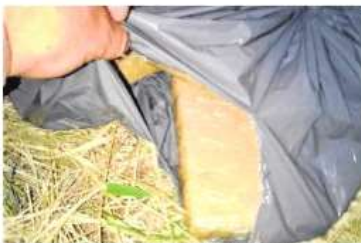
Los paquetes de marihuana fueron decomisados.