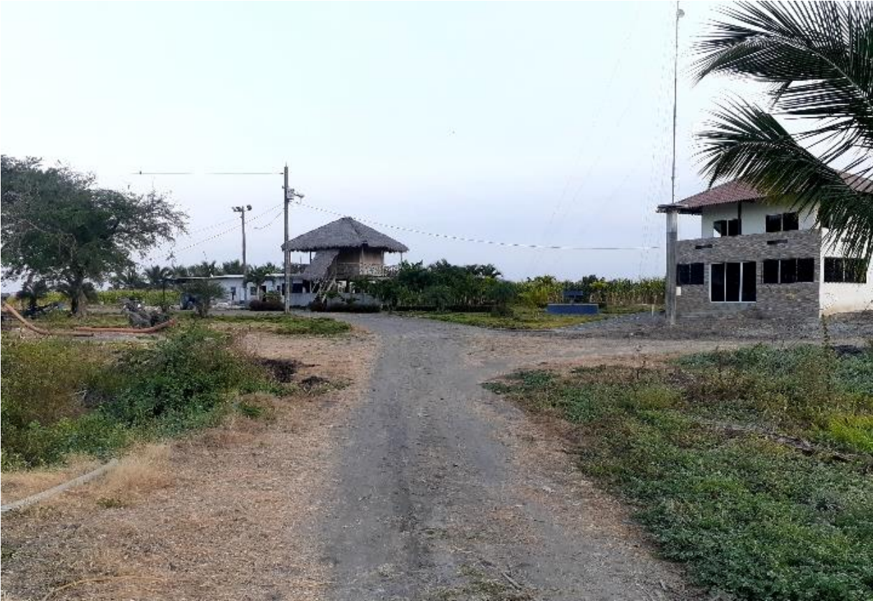
FOTO DE LA HACIENDA FIORELLA DEL CANTON SAMBORONDON