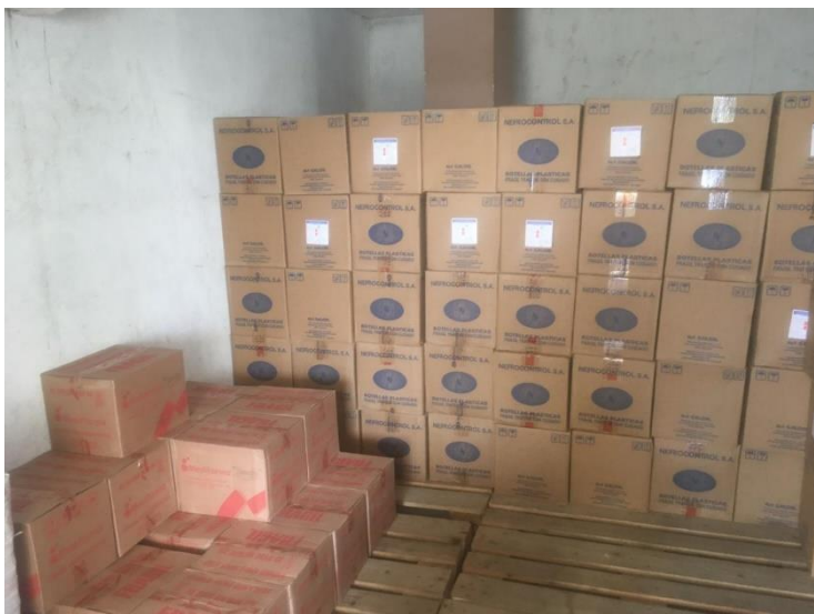
Insumos Médicos de la Unidad de Hemodiálisis Dial-Ríos (Vinces)

Nota: La distribución de los insumos se torna dificultosa al momento de ser solicitada. Elaboración propia.