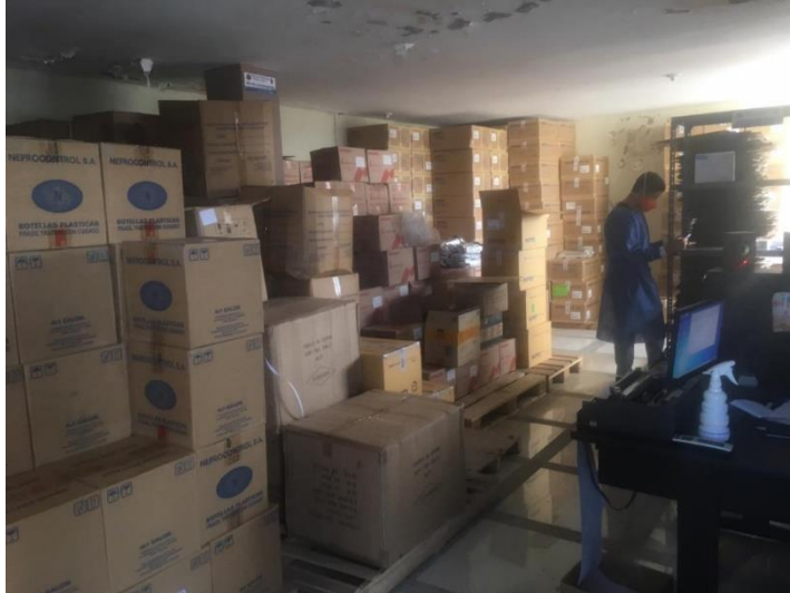
Bodega de la Unidad de Hemodiálisis Dial-Ríos (Vinces)

Nota: Abastecimiento de la mercadería aglomerada ni clasificada. Elaboración propia.