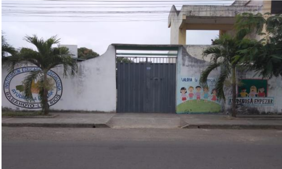
Figura 2: Institucion Educativa Especializada “Ayúdanos a Empezar”