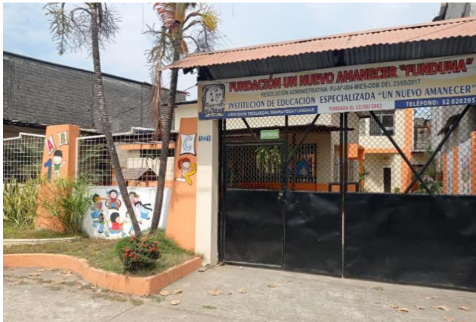
Figura 3: Institucion Educativa Especializada “Un Nuevo Amanecer”