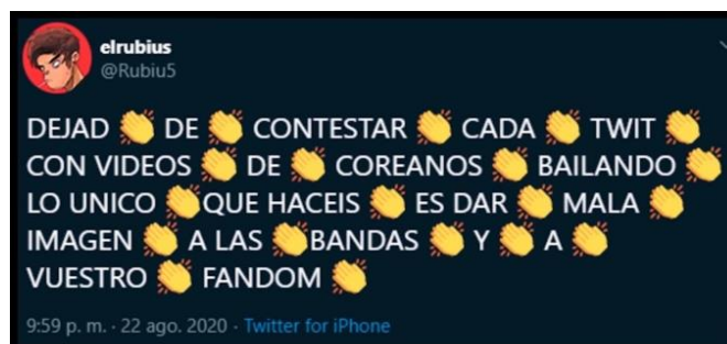
Twitter de El rubius OMG

Este video se basa en que el Rubius colgó un mensaje en su twitter, mencionando que dejen de comentar videos de los coreanos bailando, ya que lo único que hacen es dar una mala imagen por el cual el Rubius se sintió confundido ya que el tweet no fue con la intención de hacer enojar a la gente. En este video nos encontramos con una edición clásica montado imágenes y capturas y música en su mayoría animadas como por ejemplo Naruto, la calidad máxima de este video es de 1080p60, en los comentarios más relevantes eran que apoyaban al Rubius ya que hoy en día la sociedad se siente atacada por cualquier cosa.