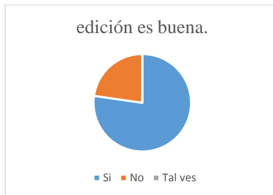
Gráfico N° 5 Edición de los videos.