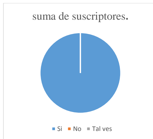
Gráfico N° 7 suma de suscriptores.