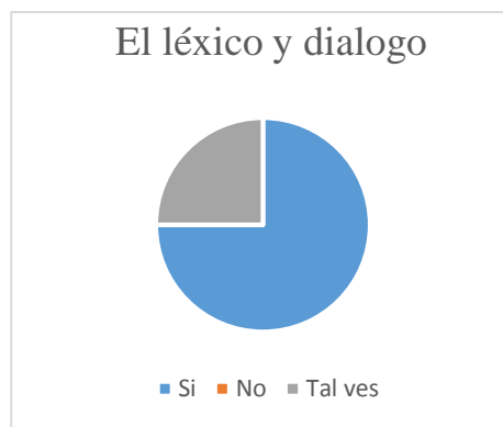
Gráfico N° 6 El léxico y dialogo.