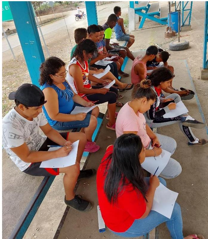
Encuesta planteada a personas consumidores de internet.