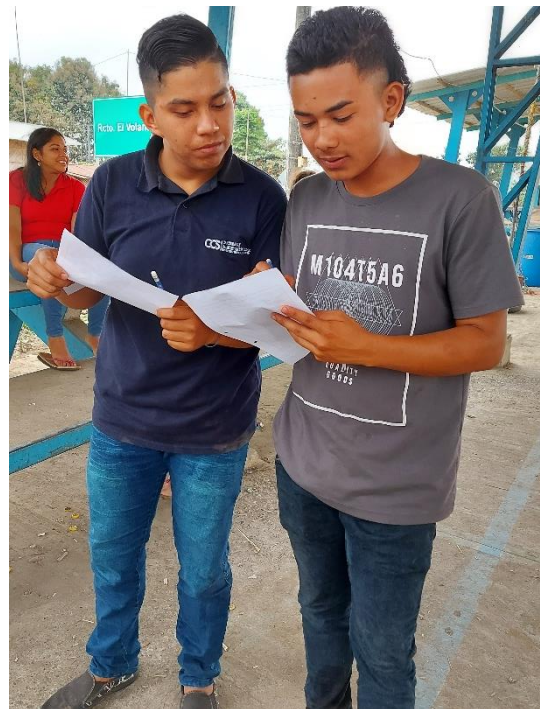
Despejando dudas sobre ciertas, preguntas a usuarios.