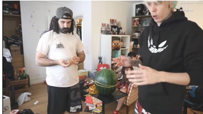
Captura del video del canal El rubius OMG

literalmente que quedo dentro de la habitación. La calidad máxima del video es de 1080p60 en un contexto natural usando palabras de su propio español.