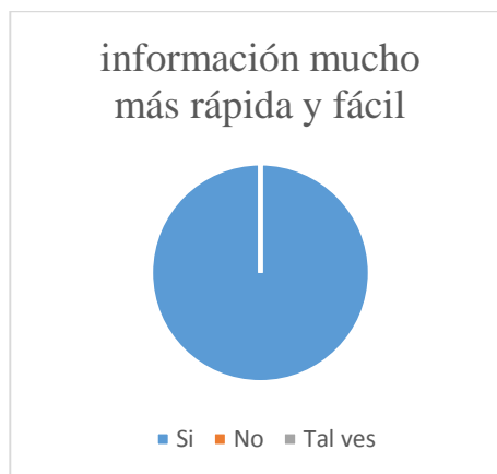
Gráfico N° información mucho más rápida y fácil.