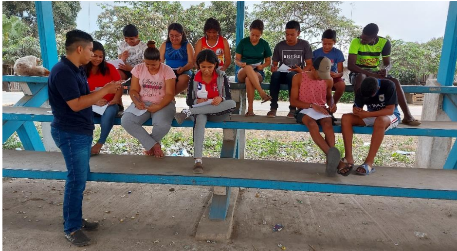
Mención de las preguntas en dicha encuesta.