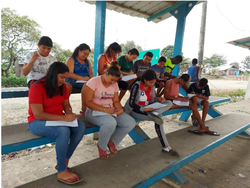
Encuesta realizada a usuarios.