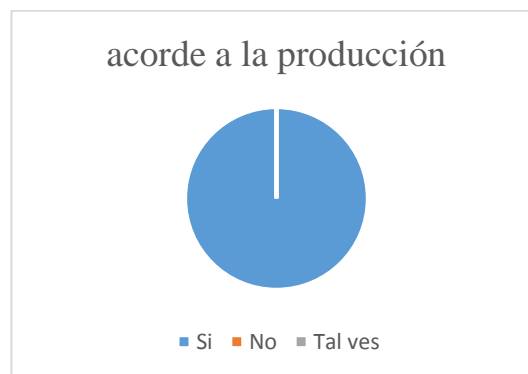
Gráfico N° 3 audiovisuales debe ir acorde a la producción?