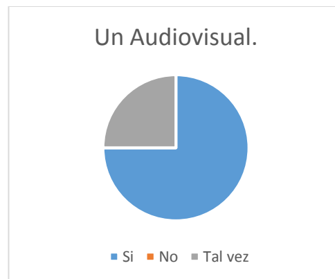
Gráfico N° 2 quiere saber y conocer.