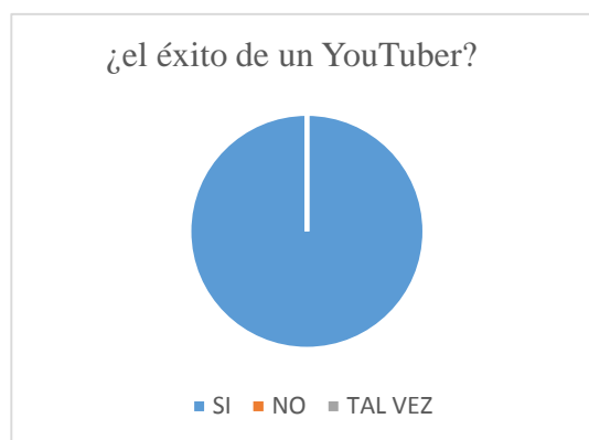
Gráfico N° 1 el éxito de un YouTuber.