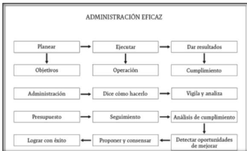
Figura 1. Administración Eficaz

proceso administrativo y control interno permite crear las mejores condiciones para el ejercicio de control de los activos fijos existentes en una institución.