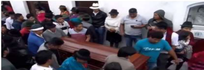
LATAQUINGA. De la morgue fue retirado este jueves el féretro con los restos de la mujer asesinada.

Las organizaciones que trabajan por los derechos de las mujeres mostraron su preocupación ayer por los casos de femicidio registrados en el país en los últimos días.