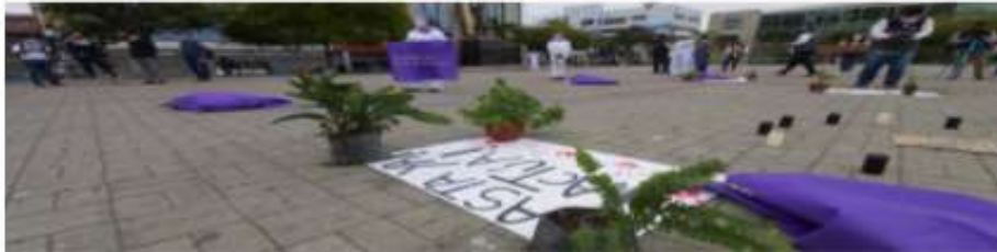
Se registran 74 femicidios a nivel nacional esta año, según el Cicam.

Una mujer fue degollada en una plantación de cacao. Ocurrió la noche del sábado en el recinto Poco a Poco de la parroquia Ricaurte, en Los Ríos.