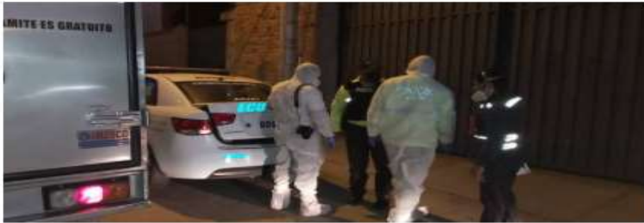
CUENCA. Una mujer fue asesinada en el barrio Totoracocha.