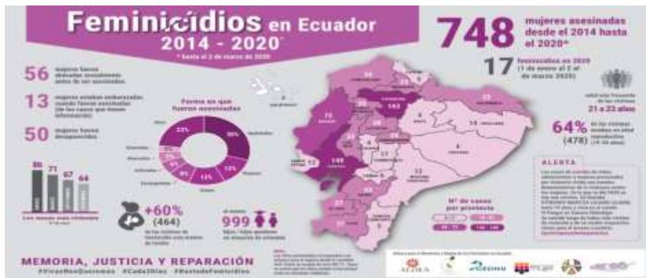
Ilustración 1 Estadísticas de casos de femicidio 2020

vidas perdidas solamente en lo que va de este año. Según las estadísticas, los meses más peligrosos para las mujeres son enero, marzo, septiembre y diciembre. Desde el 2014, la tendencia se mantiene: un femicidio cada 3 días. (ALDEA, 2020)