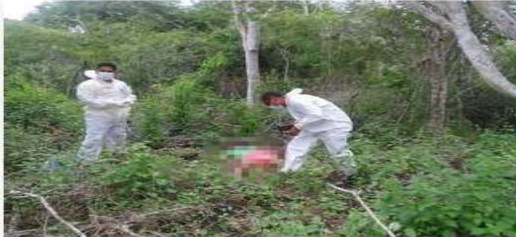
SANTA CRUZ, Galápagos. Agentes de la Policía Nacional levantaron un cadáver de sexo femenino. Familiares señalaron al exconviviente de la víctima.