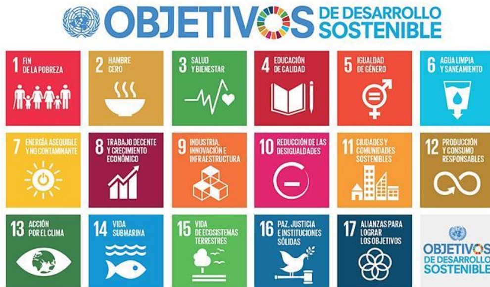
Figura 4: Objetivos de Desarrollo Sostenible

transformación universal e integra. Se muestran los Objetivos sostenibles que están inmersas en la agenda 2030.