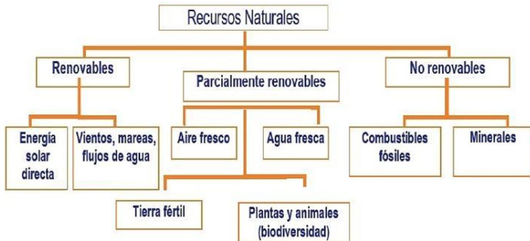
Figura 3: Clasificación de los recursos naturales

Los recursos naturales pueden variar según su clasificación, por eso, en aquel gráfico se muestra la respectiva categorización dependiendo del factor al que estén inmersos: